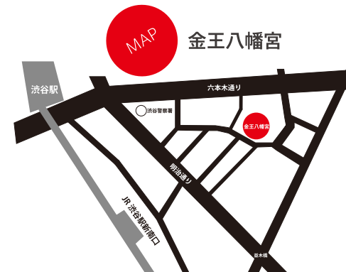
〒150-0002 東京都渋谷区渋谷 3-5-12 (渋谷駅より徒歩 5分) ※駐車場のご用意はございません