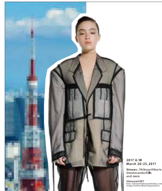
2017 A/W March 20-25, 2017 Venues: Shibuya Hikarie, Omotesando Hills, and more #AmazonFWT http://amazonfashionweektokyo.com