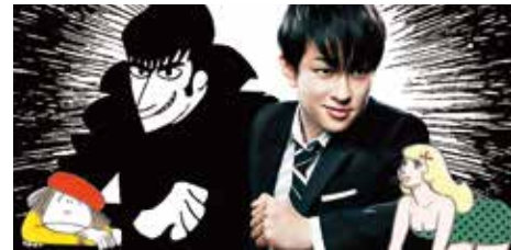
MANGA © TEZUKA PRODUCTIONS

企画・製作: Bunkamura 公演日程: [東京] 2017/5/7(日)~6/4(日) [大阪] 6/10(土)~19(月) お問合わせ: [東京公演] Bunkamura 03-3477-3244 (10:00~19:00) [大阪公演] キョードーインフォメーション 0570-200-888 (10:00~18:00)